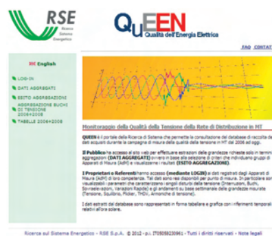
Home Page del sito web QuEEN per la consultazione dei dati registrati dal sistema di monitoraggio.

Area: Governo, gestione e sviluppo del sistema elettrico nazionale