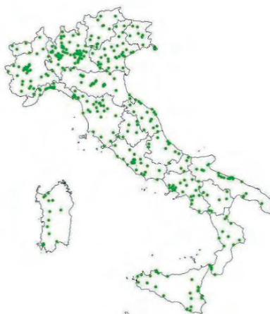
Mappa delle 400 Unità di Misura installate sulle semisbarre della rete di distribuzione MT italiana.

Nell'ambito delle problematiche della qualità della fornitura elettrica in Italia, il sistema di monitoraggio della qualità della tensione nelle reti di distribuzione in media tensione, con la disponibilità dei dati generati dall'esercizio 2006-2011 e la loro elaborazione, ha rappresentato e rappresenta un patrimonio per la caratterizzazione dello stato effettivo della qualità nelle reti di distribuzione. I dati sulla qualità sono registrati da una rete di 600 strumenti distribuiti sul territorio nazionale, di cui 400 in corrispondenza di cabine primarie, che costituiscono un campione statisticamente rappresentativo della rete di distribuzione in media tensione.