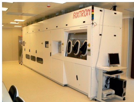
Sistema MOCVD (Metal Organic Chemical Vapour Deposition) installato nei laboratori di RSE a Piacenza